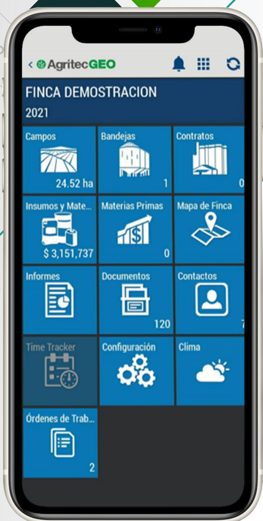
Pantalla principal de la aplicación móvil del SAF de AgritecGEO®

Adicionalmente, si usted cuenta con los servicios analíticos de AgritecGEO® todos los resultados de laboratorio de suelo, foliar y solución de suelo se cargan de forma automática a su finca para que puedan ser consultados desde el navegador o la aplicación móvil.