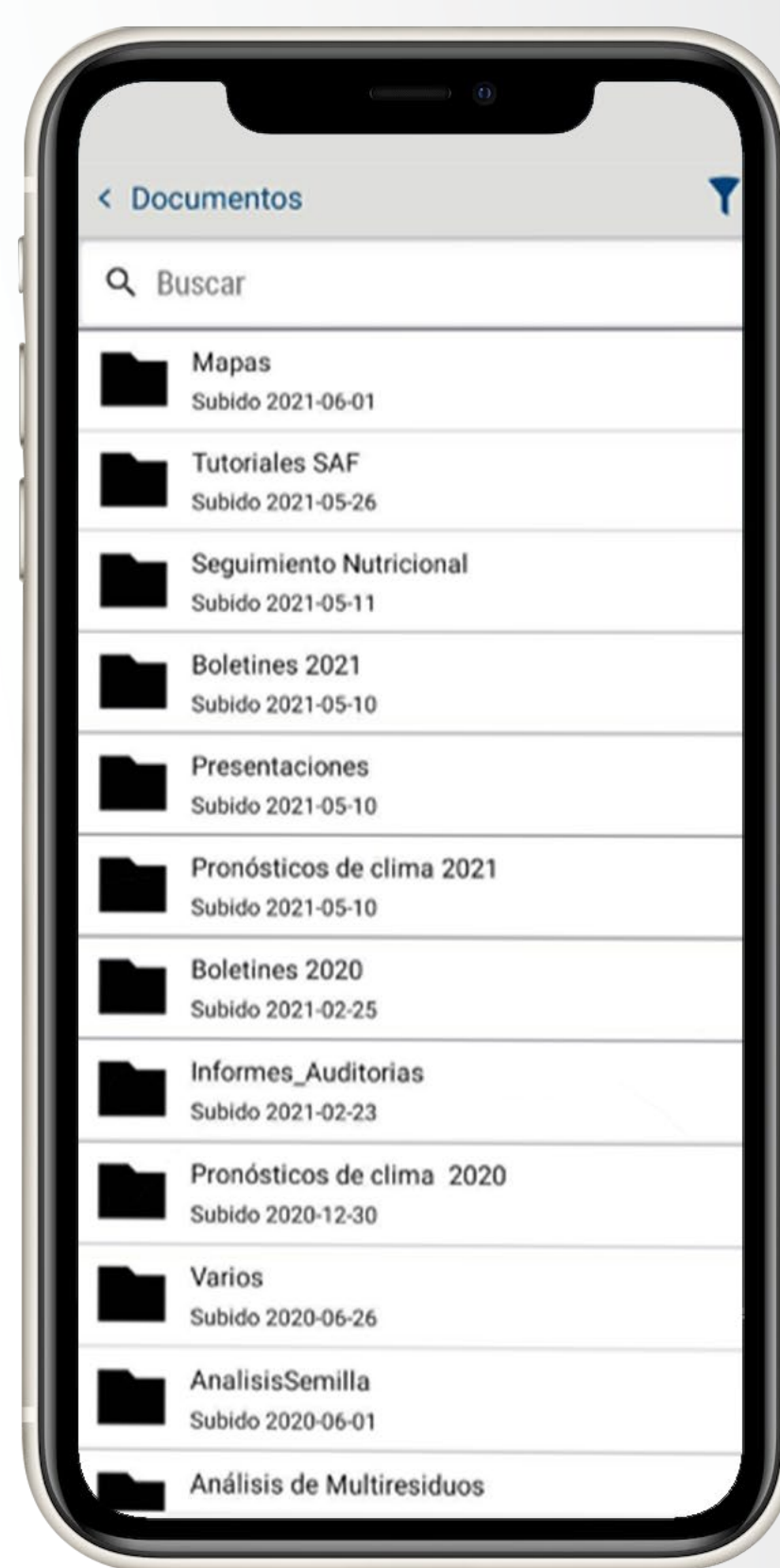
Visualización en la APP de carpetas dentro del módulo de documentos del SAF de AgritecGEO®

En el SAF de AgritecGEO® se pueden registrar todas las actividades de campo desde el celular en el momento de la actividad y luego sincronizarse con el servidor, lo que evita la necesidad de tener señal celular en toda la finca. Adicionalmente se pueden generar, desde el navegador, órdenes de trabajo, para displays y tractores inteligentes como para trabajos manuales. Estas dos funcionalidades permiten mantener un record detallado de las actividades realizadas en su finca durante el ciclo del cultivo.