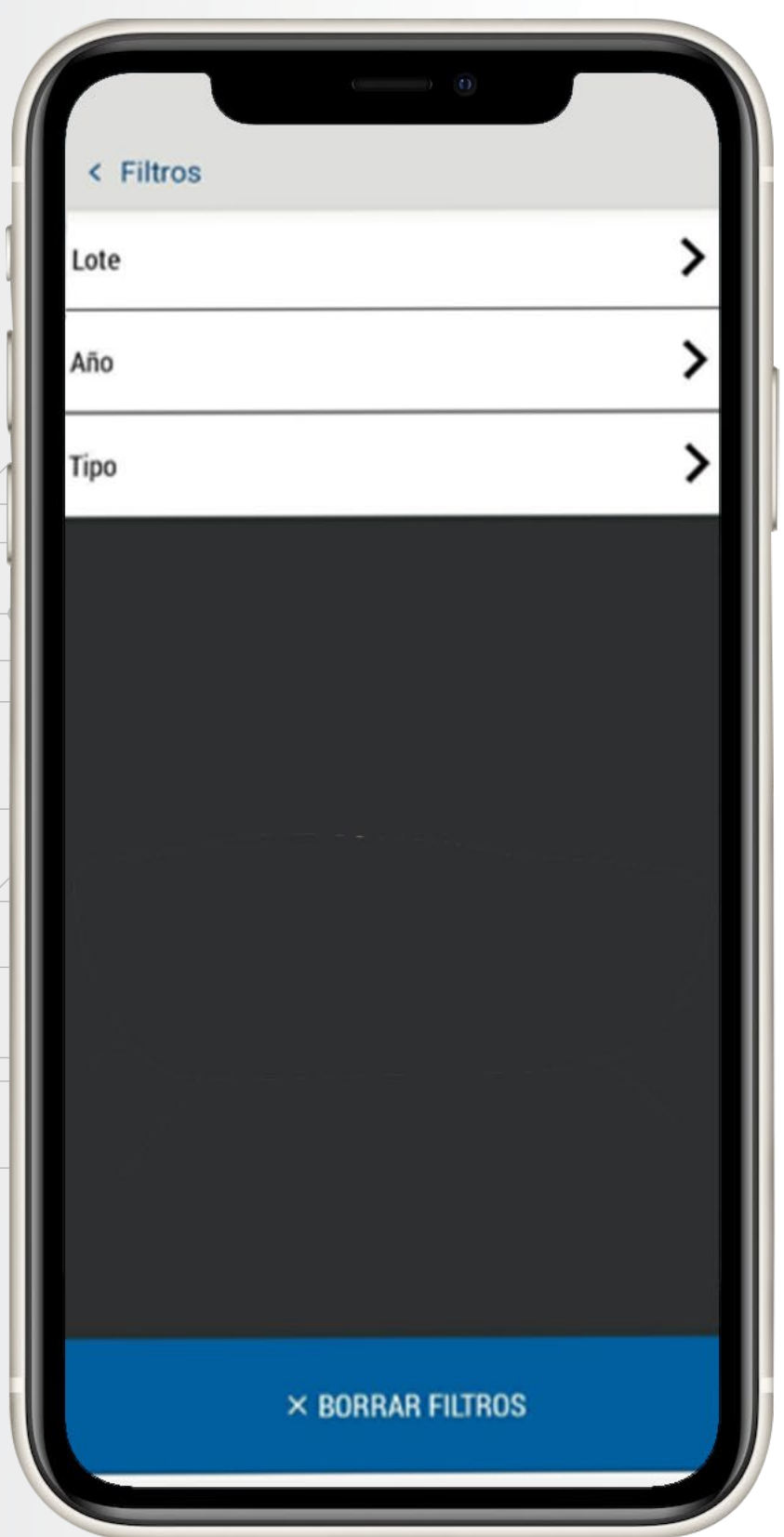
Visualización de los filtros que pueden ser aplicados en el módulo de documentos del SAF de AgritecGEO®

Una de las principales ventajas de esta funcionalidad del SAF de AgritecGEO® , es que permite centralizar el almacenamiento de la información por lo que se evitan pérdidas relacionadas a daños en dispositivos físicos o similares. De igual forma, tener la información almacenada en su usuario del SAF de AgritecGEO® permite que todos los usuarios a los que les dé acceso puedan consultar esta información desde cualquier dispositivo.