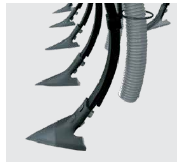
Hastes: molas superpostas para dar maior flexibilidade para o implemento. Tynes: springs to flexibility. Flejes: resorte para mejor flexibilidad.