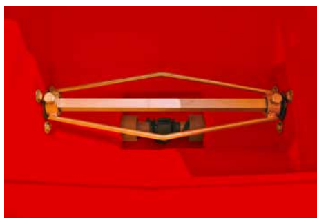
Sistema de distribuição tipo espiral flutuante com mexedor de adubo. Floating spiral type distributor and fertilizer mixer. Sistema distribuidor tipo espiral flotante con revolvedor para adobono.