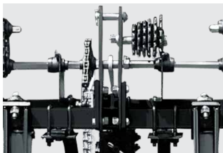
Engate hidráulico cat. I e II. Cat. I and II hitch point. Engache cat. I y II.