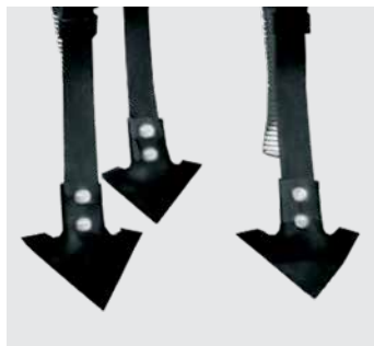
Enxadas em aço de alta resistência. Steel sweeps of high resistance. Azadas de acero templado.