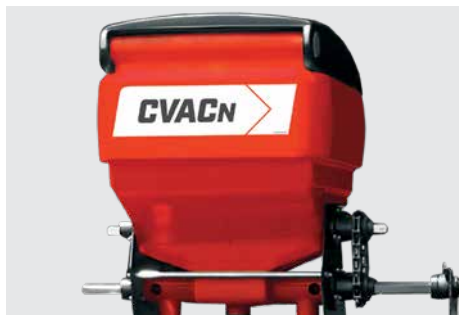
Depósito de adubo em polietileno com capacidade para 100 litros. Fertilizer hooper in polyethylene with capacity for 100 liters. Depósito de abono en polietileno con capacidad de 100 litros.