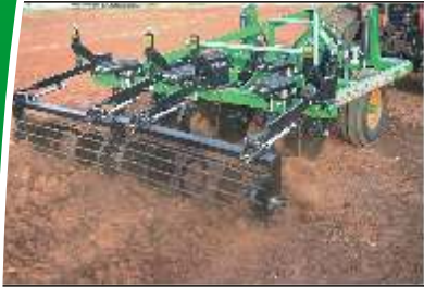
Rolo nivelador com pressão regulável. The leveling roller with adjustable pressure. Rollo nivelador con presión regulable.