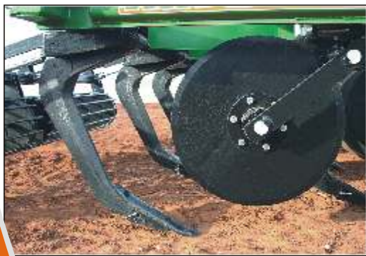
Disco independente e regulável dimensionado para o corte de grandes volumes de restos culturais. Adjustable and independent disc on size to cut a big amount of harvest remains. Discos independientes y de fácil regulación dimensionado para corte de gran cantidad de restos de cultivos.