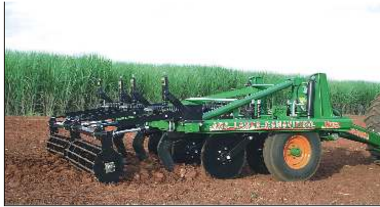
Baixo custo que proporciona alto rendimento; Preserva a palhada na superfície. Low cost that provides high efficiency; Keep the straw on the surface. Bajo costo que proporciona alto rendimiento; Mantiene la paja en la superficie.